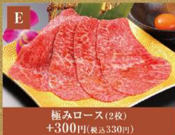
極みロース(2枚) +300円(税込330円)