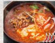
ユッケジャンスープ