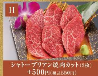
シャトーブリアン焼肉カット(2枚) +500円(税込550円)