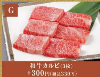
和牛カルビ(3枚) +300円(税込330円)