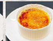
クリームブリュレ

※写真は全てイメージです。 ※季節によって、付け合わせの内容が変更になる場合がございます。 ※全てのタレ・キムチには乳糖が含まれています。