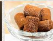
生チョコアイス(3個)