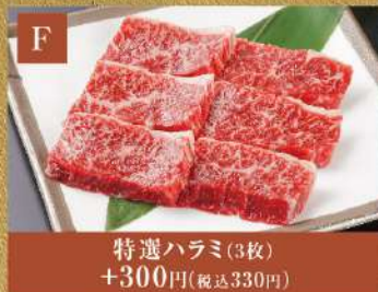
特選ハラミ(3枚) +300円(税込330円)